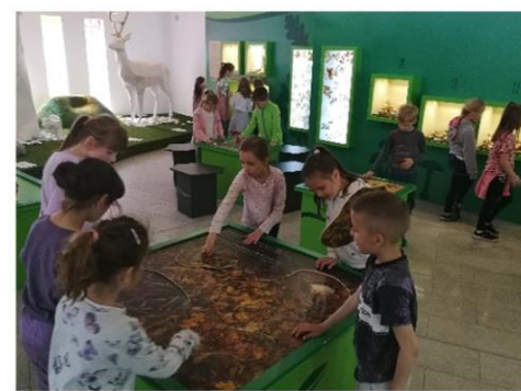
Projekt nap - Természet Háza

TANÓRÁN KÍVÜLI FOGLALKOZÁSOK (külső helyszíneken)