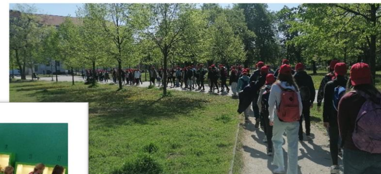
Projekt nap - Természettudományi Múzeum