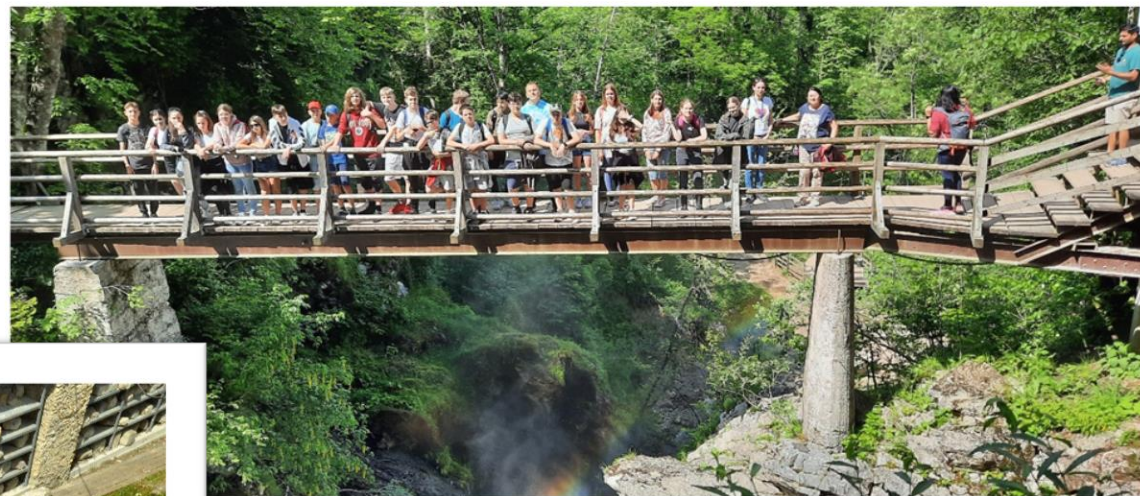
Határtalanul - Szlovénia