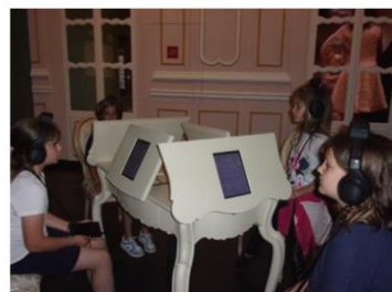
Mese délután - Festetics kastély