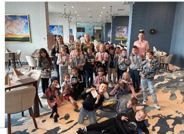
Sirius Hotel**** látogatása