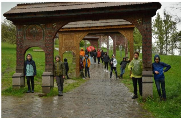
Határtalanul - Erdély